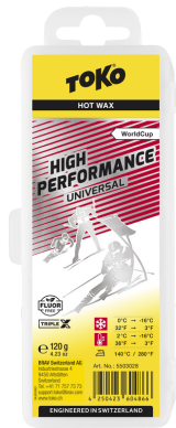
HP Hot Wax universal/red

Reccomandation: Recommandés: Consigliati: